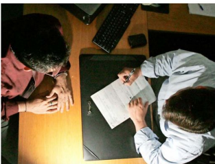
El tiempo promedio entre que la licencia es otorgada y pronunciada en las aseguradoras privadas es de 5,8 días corridos, y en casos confirmados de covid-19, de 5,5 días corridos.

Respecto al Fondo Nacional de Salud, el tiempo que media entre que el